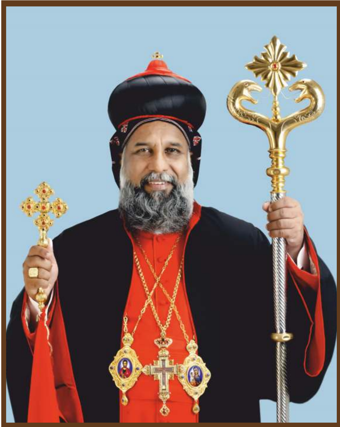
Baselios Cardinal Cleemis

Major Archbishop Catholicos of the Syro-Malankara Catholic Church