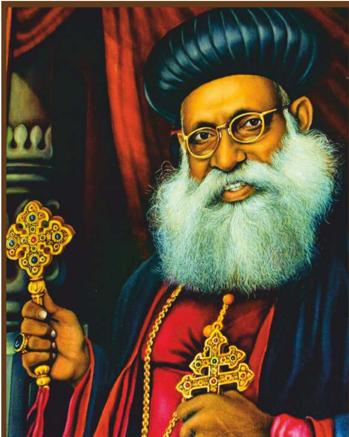
Father of Reunion Movement Archbishop Most Rev. Geevarghese Mar Ivanios OIC.